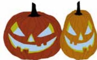
Kürbis schnitzen und Kürbis-Suppe am Donnerstag

Ludwig Café | Bar (Proma Do-Sa) Bratwurst, Kinderpunsch, Glühwein